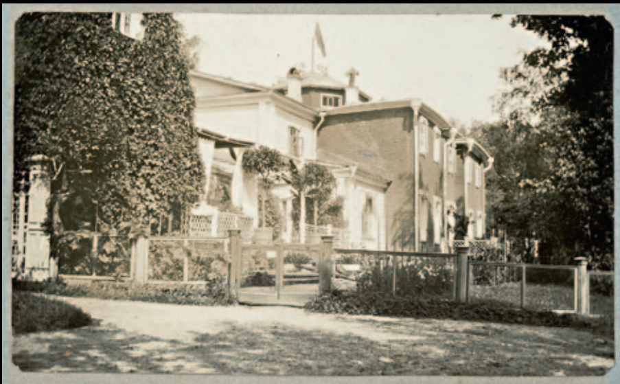
↑ Мурановский дом со стороны галереи. Фотография Фёдора Тютчева (?), внук поэта. 1910-е. КП-2573/10