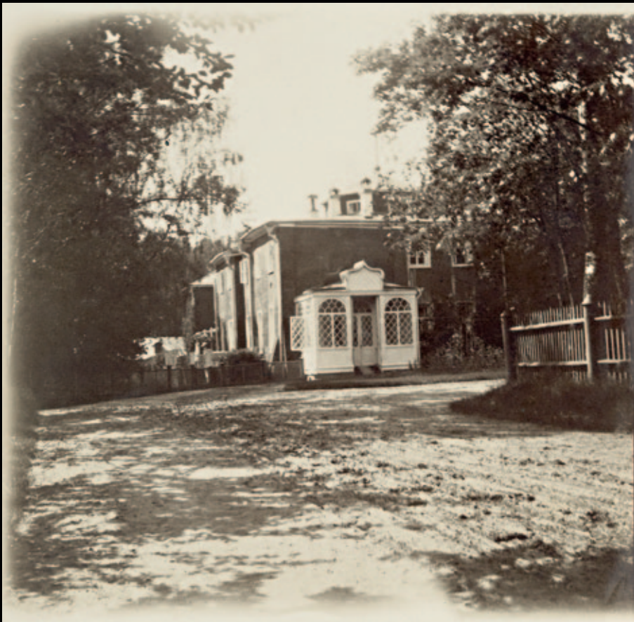
↑ Мурановский дом со стороны подъезда. Фотография Фёдора Тютчева (?), внук поэта. 1910-е. КП-2573/3